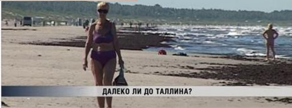
ДАЛЕКО ЛИ ДО ТАЛЛИНА?

disid. Eestis kōnniti koku 26 pāeva, sellest Harku vallas 1,5 pāeva. Matkaraja celvītmast, 22 kilomeetri pikkust lōiku Vāina-Jōesuu rannast Tallinna piirā asuva Lauca restorānā lābis koos Jurise ja 11 matkalēsa ka Harku vallavalītsuse keskkonnaspešialist Lembe Reiman. madalamas kohas raja lābīmsēga olla problēme. Vana rada kāidi uuesti lābi Harku vallas tāhstāti rahvasvalēme matkarada E9 jūba 2000. aastate alguses valge-sini-valge mārgistusega puude ja kiveid peal ning mārgistat uendati vie aasta eest Harju matkākūibi cestvedāmīel Kuigi Harku valla ūldplāneeringu kaardile on see rada kantud, on loodus ja inimesed aastēga teinud oma tōo ja nūd kāidi rada uuesti lābi tāpēmaks mārgistāmīeks. Lāānemere ranniku matkaraja projekt lōpē 2019. aasta oktobrīn ning projekti edenemist saab jālgēda Rannikuraja Facebookīleht: www.fb.com/rannikumatkarada. RUTH MĀGI