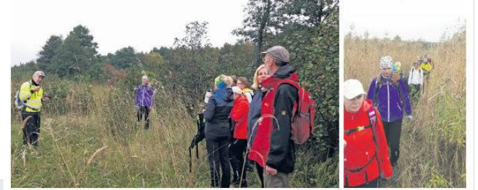
Matkajate sōnul on rada hāsti lābīvat, ehkī vīhņaste ja tormiste ilmdē vōi mēreeve kōrge taseme ajal vōi mōnes madalamas kohas raja lābīmsēga olla problēme.

24. septembrist 1. oktobrini mārgiti Lāāne-Harjumaal maha Lāānemere ranniku matkaraja viimane lōik, mis kulgeb lābi Harku valla.